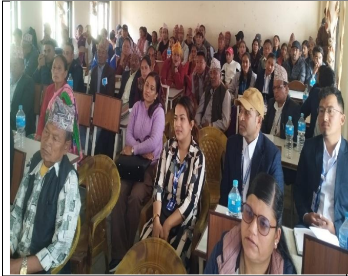
सार्वजनिक सुनुवाईमा उपस्थित नागरिकहरु ।