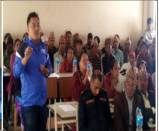
सार्वजनिक सुनुवाईमा प्रश्न गर्दै सेवाग्राही ।