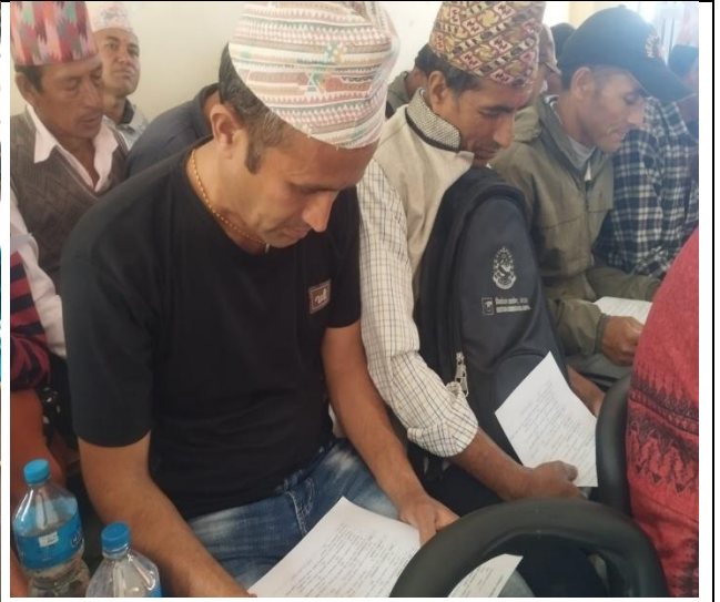
सार्वजनिक सुनुवाईमा नागरिक सन्तुष्टी सर्वेक्षणको प्रश्नावली भर्ने सेवाग्राहीहरु ।