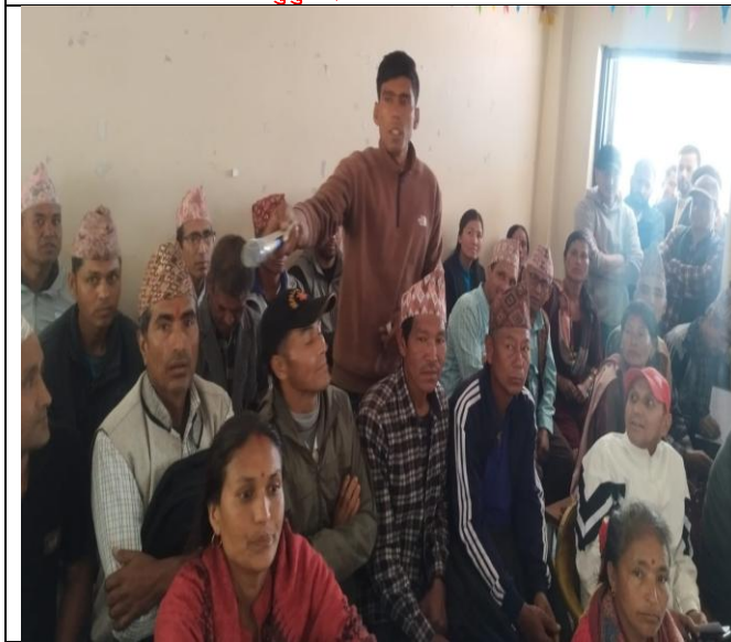
सार्वजनिक सुनुवाईमा प्रश्न गर्दै सेवाग्राही ।