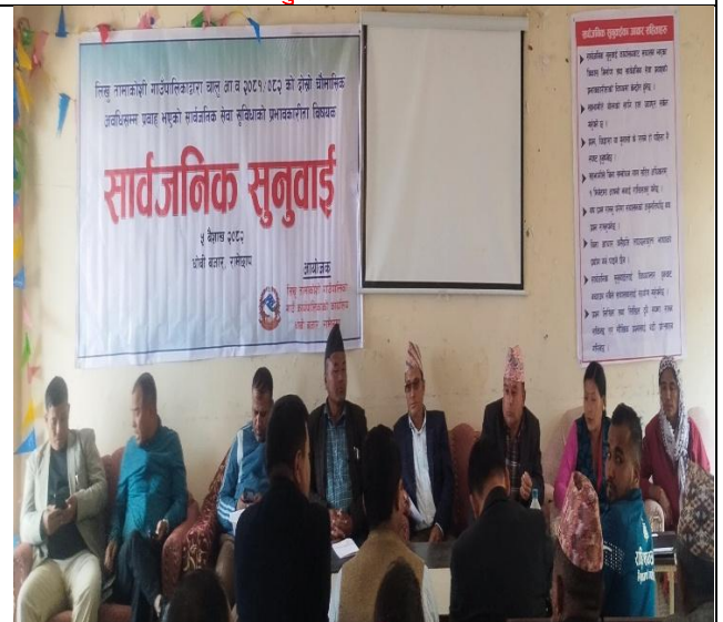
सार्वजनिक सुनुवाईका जवाफदेही बक्ता ।