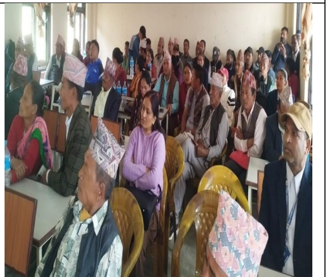
सार्वजनिक सुनुवाईमा उपस्थित नागरिकहरु ।